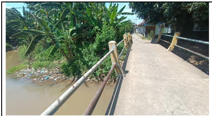
KONDISI LANTAI DAN SANDARAN

JL. MADUKORO RAYA NO. 7, TELP. (024) 76433969, FAX. (024) 76433969 KOTA SEMARANG