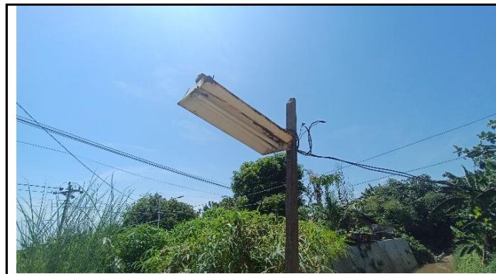
LAMPU PENERANGAN JEMBATAN