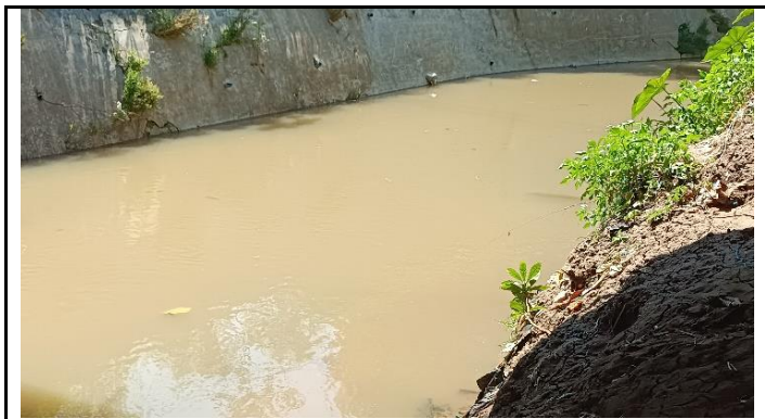
KONDISI ALIRAN SUNGAI