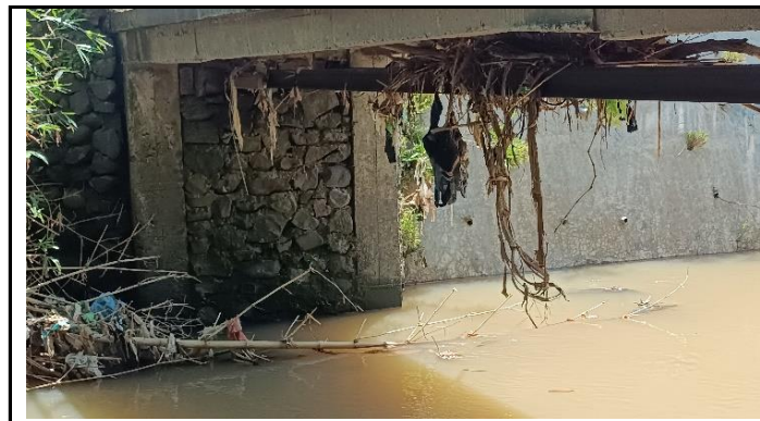
KONDISI GELAGAR DAN KEPALA JEMBATAN