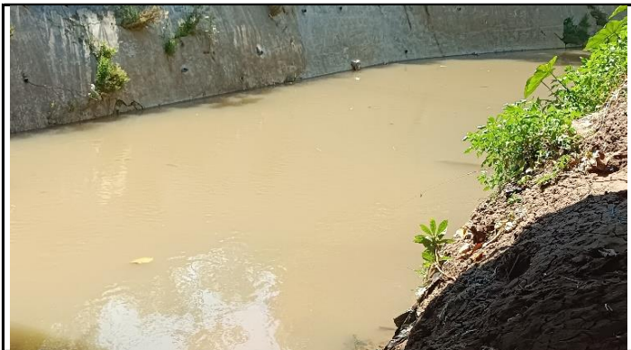
KONDISI ALIRAN SUNGAI