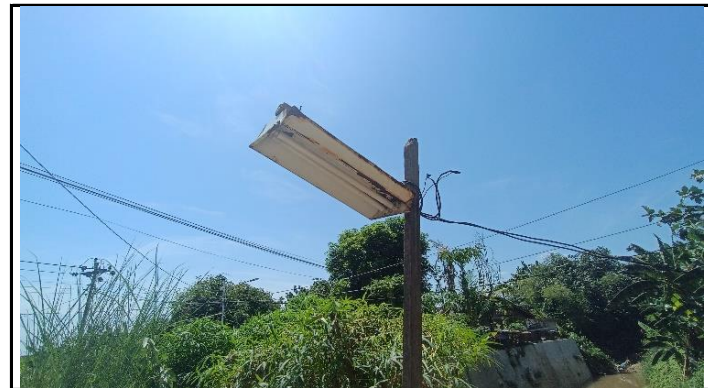
LAMPU PENERANGAN JEMBATAN