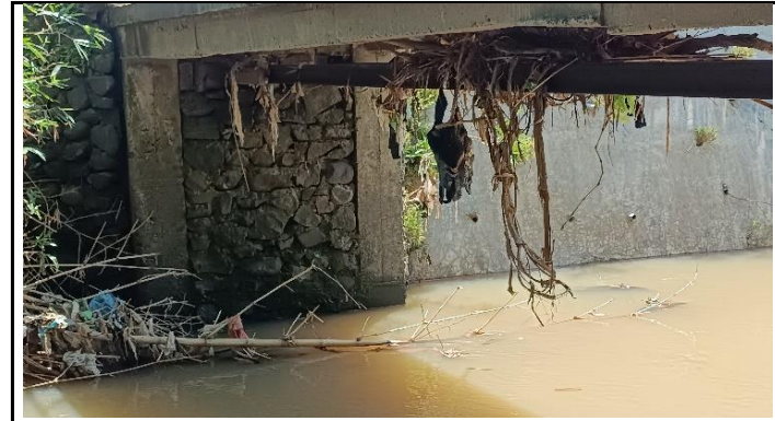
KONDISI GELAGAR DAN KEPALA JEMBATAN