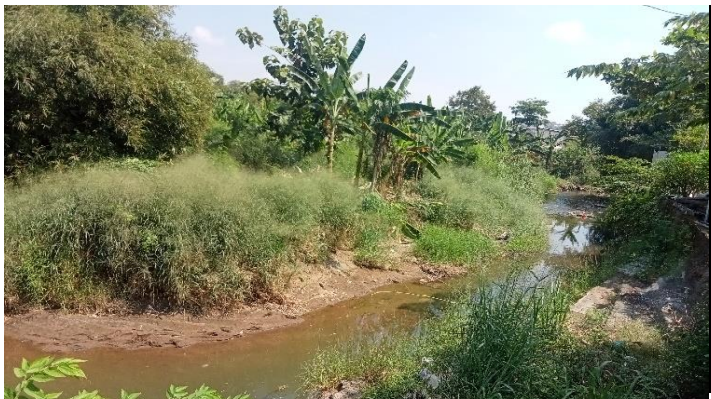
KONDISI ALIRAN SUNGAI