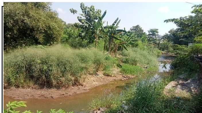
KONDISI ALIRAN SUNGAI