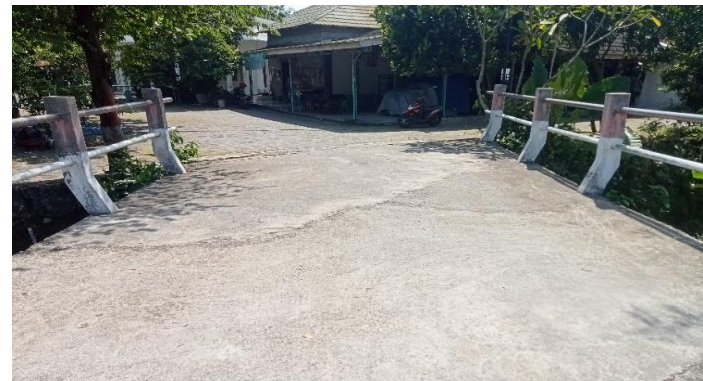
KONDISI LAPISAN PERMUKAAN LANTAI