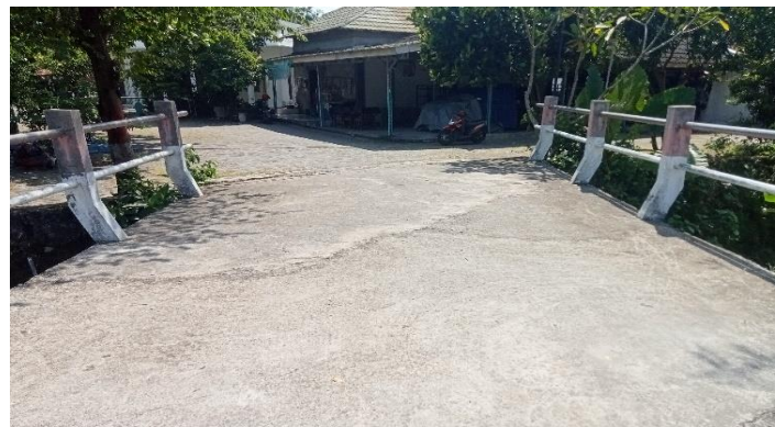
KONDISI LAPISAN PERMUKAAN LANTAI