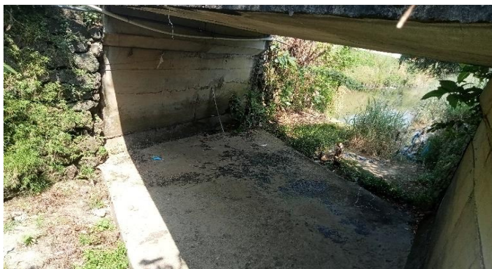
KONDISI BANGUNAN BAWAH

JL. MADUKORO RAYA NO. 7, TELP. (024) 76433969, FAX. (024) 76433969 KOTA SEMARANG